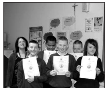
Manchester-i diákok okleveleikkel

IT-tanára. A tanulók végigtanulmányoztak egy füzetet és több honlapot, majd plakátokat készítettek fiatalabb diákoknak a biztonságos internetezésről. Akik elvégezték a tanfolyamot, oklevelet is kaptak. □