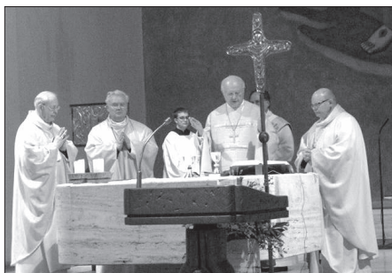
Püspöki szentmise a Collegium Borromaeum templomában. Balról: Rainer Klug freiburgi segédpüspök, Cserháti Ferenc, a külföldön élő magyarok püspöke, Robert Zollitsch freiburgi érsek, a Német Katolikus Püspöki Konferencia elnöke és Josef Voss münsteri segédpüspök

Pálfordulók püspöki szentmisével emlékeztek Szent Pál apostol születésének 2000. évfordulójára a Rajna menti magyarok Freiburgban és Offenburgban, ahol Cserháti Ferenc, a külföldi magyarok püspöke éppen e napon látogatta meg az itteni két magyar közösséget. Szentbeszédében a főpásztor emlékeztetett arra, hogy XVI. Benedek pápa 2008–2009-re jubileumi évet hirdetett, ugyanis a történelem Kr. u. 7. és 10. közé teszük Szent Pál születésének évét. Kiemelte, hogy Szent Pál apostol megtérése napján ünnepén gyűltünk össze, szülőföldünk-től, hazánktól, illetve óhazánktól távol, idegen környezetben, egy kicsit vándorként, mint emigránsok vagy migránsok, tanulók, munkakeresők és munkavállalók. Szent Pál élete sok tekintetben párhuzamot mutat a miénkkel. Mint a népek apostola, különböző népek, nemzetek és kultúrák között élt és hirdette az Evangéliumot. Apostoli útjai során először a zsinagógákban hirdeti az Evangéliumot, különösen nagy figyelmet szentelve szórványban élő honfitársainak. Csak miután ezek elutasították, fordult a pogányok felé és lett Isten utazó nagykövete. Serkentés ez minket is arra, hogy összetartsunk, rendszeresen és buzgóan látogassuk a magyar szentmiséket, gyakran részestülünk az Eucharisztiaiból, amely éppen a testvériség, a szeretet, az összetartás szentsége – mondta a főpásztor. A szentmise után mind-