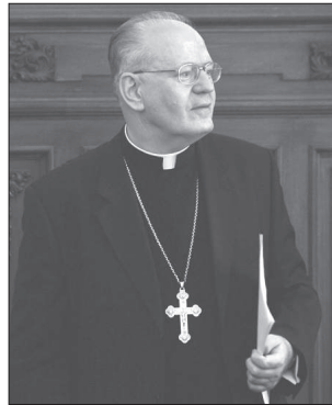
Erdő Péter bíboros primás, esztergom-budapesti érsek

cia a Szlovák Püspöki Konferenciával találkozik és beszél egy-egy kérdésről, akkor mindig tekintettel van az ottani magyar papok és hívek véleményére is. Reális helyzetfelmérésre, igényfelmérésre van szükség, hiszen így tudjuk segíteni az ottani magyarságot abban, hogy betölthesse a híd szerepét, és így tudjuk segíteni az ottani, többségi nemzettel való kapcsolatát is. Tudjuk, hogy a pozitív fejlemények soha nem válnak ki olyan visszhangot, mint a negatívak – talán nem is mindenkinek az a szándéka, hogy a pozitívumokat erősítse –, nekünk azonban az a hivatásunk és a kötelességünk, hogy ezt erősítsük. Ebbe nem szabad beleférdani. A XX. századi magyar történelem sok-sok tanulsággal jár számunkra, és az igazi hazaszeretet nem csügged el. Az viszont kétségtelen, hogy lélekben mindig igényesnek kell lenni, és a lehető legjobb megoldásokra kell törekedni. Ez néha nagyon nehéz, de katolikusként nem látunk más alternatívát.