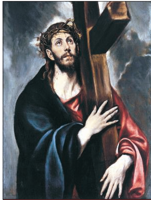
El Greco (1541–1614): Krisztus a kereszten (Metropolitan Museum of Art, New York)