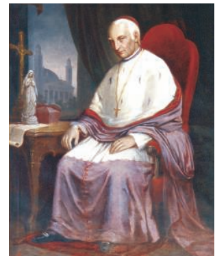
Hám János (1781–1857) szatmárnémeti megyéspüspök, aki a szabadságharc alatt esztergomi érsek és Magyarország hercegprímása volt (A szatmári püspökség festménye. Fotó: Fazekas József Tamás)

Damjanich János tábornok 1849. április 4-én, nagypénteken felelőtlenül és igazságtalanul kivégeztette az ártatlan Mericzay János szecsói és Hernegger Antal kővári plébánost. A szabadságharc hősi tábornoka a kivégzése előtt biztos, hogy nagyon megbánta ezt az örült parancsát, mert bocsánatkéréséért és engesztelésül katolikusként halt meg.