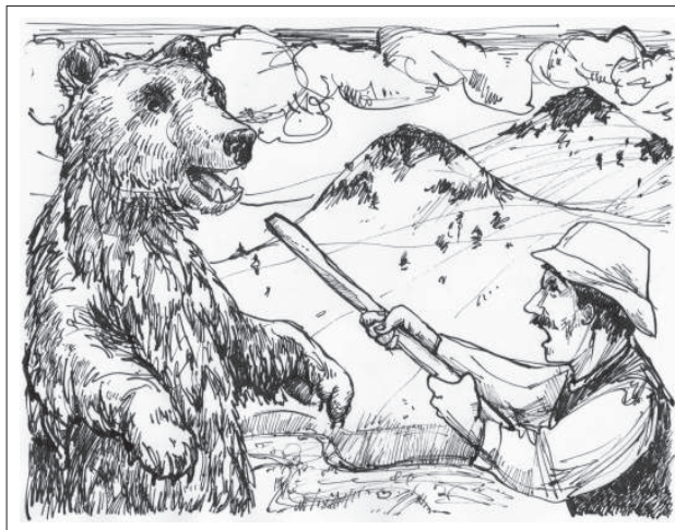
Nagy Boglárka rajza

Így tréfálkoztak a medve fölött, majd megszüntették a tüzet, s lassanként elaludtak. A csillagok még tündököltek egy ideig, aztán dél felől meleg fuvalom keletkezett, s felhőket hajtott a csillagok elé. Hajnalban már erősen gomolygott a