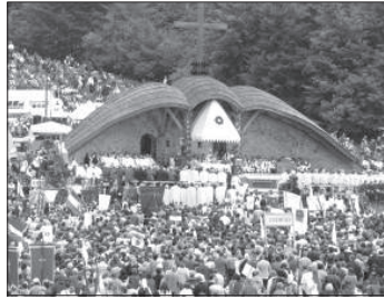
A két Somlyó-hegy közötti Nyerget ismét megtöltötték a zarándokok

Isten nem lehet nagylelkűségben felülmúlni. Ő a lelki erősség adományát is ne-