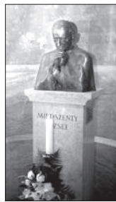
szertartás szerint Mindszenty bíboros egyetlen elődje sem végzett annyi főpapi szertar-

tást a Szent István-bazilikában, mint ő. „A negyvenes évek vége felé én is ott szorongtam egy alkalommal a bazilikában, amikor a hercepprimás beszélt. (...) Megemletem egyik lábomat, hogy kissé jobban helyezkedjem a minden oldalról nyomó tömegben, s a beszéd végéig nem tudtam többé visszaállni helyemre: kénytelen voltam egy lábom maradni végig. Szó szerint minden talpalmatnyi hely el volt foglalva” – írja.