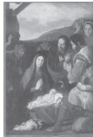
A pásztorok hódolata, José de Ribera (1591-1652), Louvre, Párizs

családapai szerepe és békét akaró tevékenysége manapság is példaképpül szolgál számunkra. Várjuk a többi szentéletű magyarnak oltára emelését, Mindszenty hercegprímással a többi püspök, és az egyszerű népből fakadó fiatalok elisme-