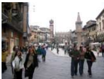
Piazza delle Erbe