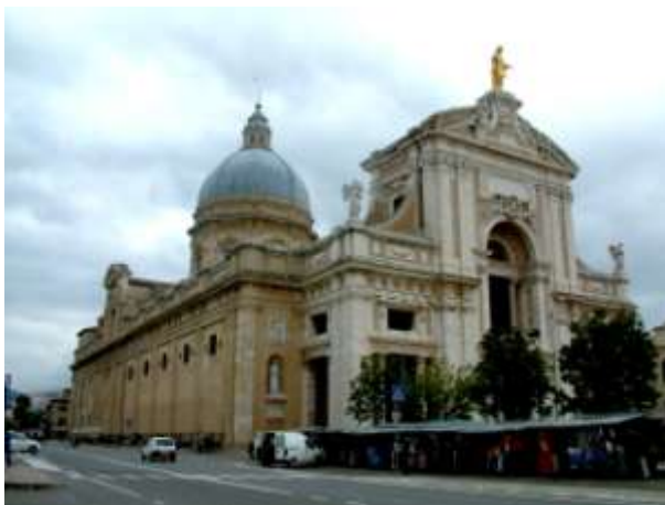
Santa Maria degli Angeli

8.00-kor hálaadó szentmise a Santa Maria degli Angeli-bazilikában, majd indulás haza