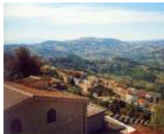
San Marino-i látkép

San Marino a világ egyik legkisebb állama s egyik legősibb köztársasága, alig tíz kilométerre Riminitől és az Adria partjától. A legenda szerint Marinus, egy keresztény kőfaragó rabszolga Dalmáciából, üldöztetéseivel menekülve átkelt az Adrián, s remeteként letelepedett az akkor még vad, úttalan Monte Titanón. Ott alapította meg a San Marino-kolostort. A kolostor körül hamarosan környékbeli lakosok telepedtek meg; így jött létre a Monte Titanón (739 m magas). San Marino helység, a császároktól és pápáktól független, semleges köztársaság.