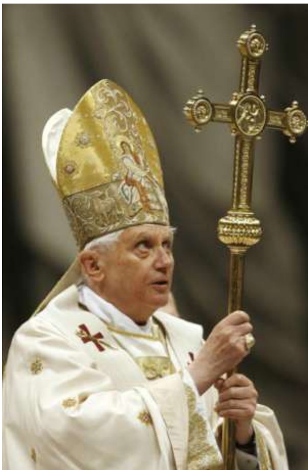
XVI. Benedek pápa