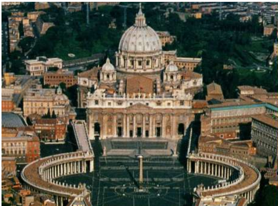
Szent Péter-bazilika és a Vatikán