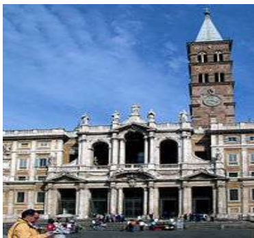
Santa Maria Maggiore