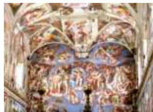
Michelangelo: Utolsó ítélet

Délután: Vatikáni Múzeum, Sixtus-kápolna, Szt. Péter-bazilika, kupola