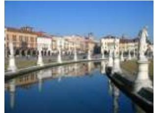
Prato della Vale-tér

A Szt. Antal-bazilika a 13.-14. században épült román, gót és bizánci stílusformák keveredésével. A templombelsőt figyelemre méltó alkotások díszítik. A bal kereszt-hajójában van a Szent Antal kápolna , itt őrzik a Szent földi maradványait. A kápolnát 9 db. márvány dombormű díszíti, mely a Szent életéből vett jeleneteket ábrázol. A templom főoltárát 1443-1450 között Donatello készítette, melyet Jézus szenvedés-történetéből vett jelenetek és Donatello-bronzfigurák díszítenek. A szentély körüljáró meghosszabbításában épült a Cappella Tesoro , mely a Szent életéből maradt tárgyi emlékeket, relikviákat tartalmazza . A templom előtti téren áll Gattamelata lovasszobra , mely Donatello alkotása 1453-ból. A bronzból készült mű Erasmo de Narni velencei hadvezért ábrázolja.