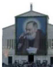
S. Giovanni Rot.