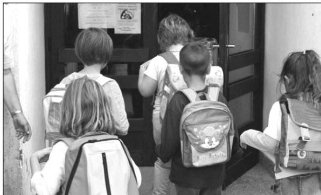
Először legyen tisztában saját identitásával!

góban ők tiltakoznak majd, ha a ma- gyarság érdekeinek határozott érvénye- sítéséről van szó. Azt mondják, írják, su- gallják magyar nyelven, de idegen szív- vel a média, politikai pártok s akár egy- házi vezetők által is: „Nem kell elégedet- lenkedni, nem kell tiltakozni, nem kell