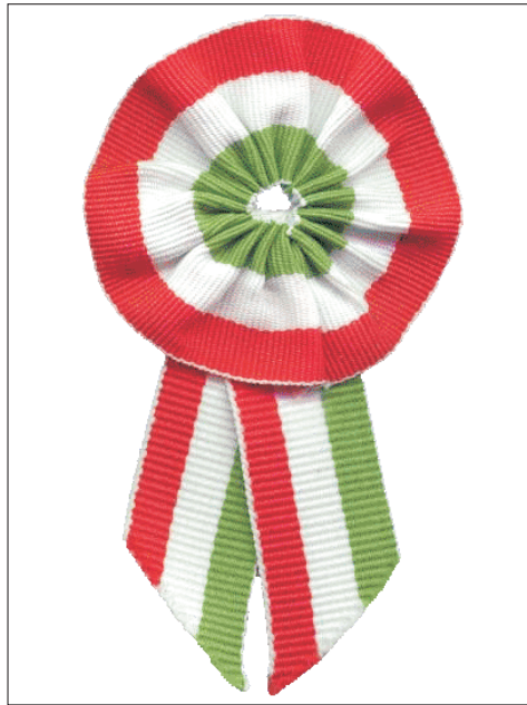
Március 15. – nemzeti ünnep