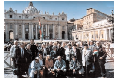
Stuttgarti magyarok a Szent Péter téren