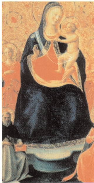
Fra Angelico: Madonna a gyermekkel, 1435 k.

tanítványa, így szólt anyjához: „Asszony, nézd, ő a te fiad!” Aztán a tanítványhoz fordult: „Nézd, ő a te anyád!” Attól az órától fogva házába fogadta őt a tanítvány.”