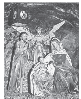
A Kiszűvés megszületett övendűnk! Betlehem-részlet