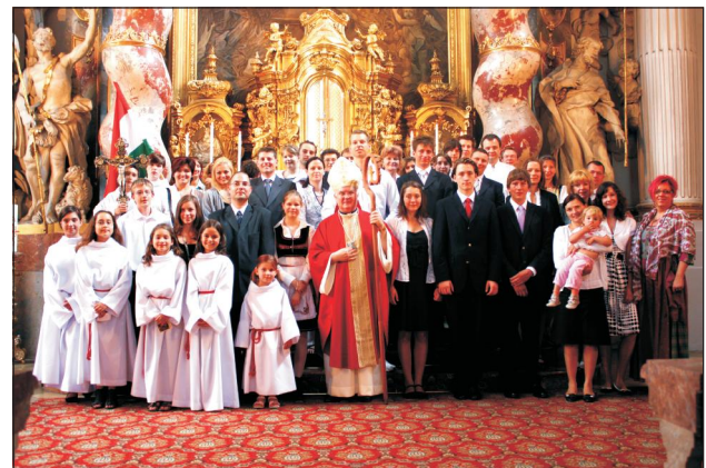
A müncheni bérmálkozók és a hívek Cserhádi Ferenc püspökkel