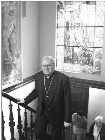
Erdő Péter bíboros július 18-án ellátogatott a belga főváros Magyar Házába, ahol Havas István brüsszeli magyar lelkésszel közös szentmisét mutatott be. A főpásztor a liturgiát követően a kápolnában találkozott a magyar hívekkel

Egyházunk szociális tanítása szerint az emberiség és minden ember Isten szeretete folytán létezik. Ez az szeretet, amely minket a másik ember elfogadására és szeretetére indít. Ezért van az, hogy Egyházunk – éppen a hit alapján – ma is igyekszik az önfeláldozó tevékenységre szociális területen, mégpedig nemcsak intézményes segítség, hanem személyes kapcsolatépítés és nevelés útján is. Az Egyház tehát olyan humanizmusra akarja felhívni a figyelmet, amely – Az Egyház társadalmi tanításának kompendiumát idézve – „megfelel Isten történelmi szeretetvének. Ez átfogó és szolidáris humanizmus, mely alkalmas rá, hogy olyan új társadalmi, gazdasági és politikai rendet eredményezzen, amely minden emberi személy méltóságára és szabadságára épül.” □