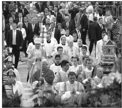
Egyházi és állami vezetők a Szent Jobb-körmeneten

Igazságosságra az idősebb nemzedékek íránt, akik egész életük során azért nem kapták meg munkájuk ellenértékét, mert az állam – úgymond – garantálta nekik öregségük és betegségük esetére a teljes ellátást és gondoskodást. Ha valaki becsületesen dolgozva élte le az életét, aligha mondhatjuk a szemébe, hogy ezeket a szolgáltatásokat ő már nem kapja, mert ez nem korszerű, vagy nem gazdaságos, vagy nem fér bele valamilyen előre meghatározott keretszámba. De szükséges az igazságosság a fiatalabbak iránt is. Különösen az anyaság és a családi élet teremt olyan értéket, amely a bér munka fogalomvilágában nem jelenik meg, de amelytől népünk élete, testi-lelki egészsége, jövője függ. Bizunk abban, hogy mindezekben a kérdésekben az igazságosság és a szolidaritás eszménye érvényesülhet – mondta Erdő Péter bíboros, a Magyar Katolikus Püspöki Konferencia elnöke.