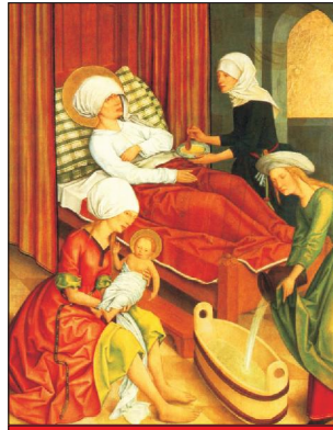
Szűz Mária születése (Staatsgalerie, Stuttgart) A pfullendorfi oltárképet készítő mester