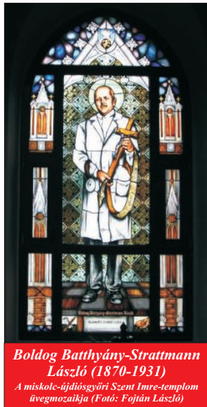
Boldog Batthyány-Strattmann László (1870-1931) A miskolci-újdiósgyőri Szent Imre-templom üvegmozaikja