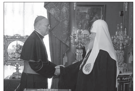
II. Alekszij pátriárka 2007 júniusában fogadta Erdő Péter bíborost, aki az Orosz Ortodox Egyháznak ajándékozta Szent István király ereklyéjének egy részét

December 9-én az Egyház és a politika magas rangú képviselőinek jelenlétében megtették el II. Alekszij pátriárkát. Több mint 80 000 ember tette tiszteletét a moszkvai Megváltó Krisztus-székesegyházban felavatott egyházfő előtt.