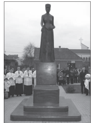
A Szatmárnémetiben újonnan felavatott Szent Erzsébet-szobor