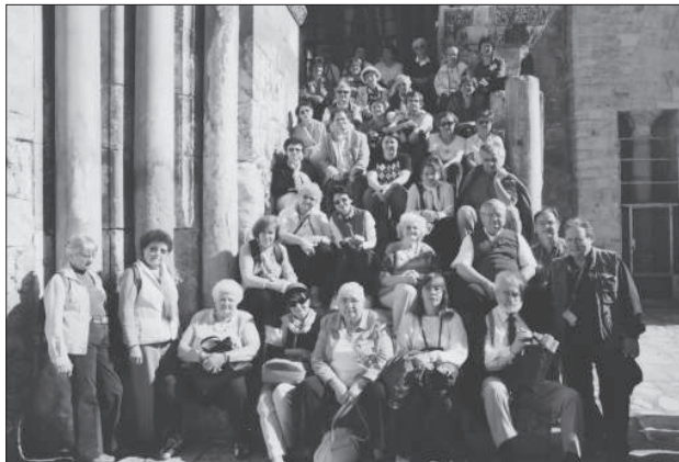
Németországi magyar zarándokok a Szent Sír-bazilikánál