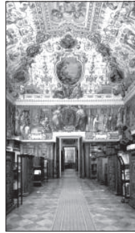
A vatikáni levéltár egyik freskókkal díszített szobája

reformációval kapcsolatban is bőven akad dokumentum a vatikáni levéltárban: megőrizték például X. Leó pápa dörgedelmes sorait, amelyben a kiközösítést is kilátásba helyezi Luther Márton számára. Ugyanabban a kötetben – egy 1521-ben kelt dokumentum – már a szakadár német szerzetes végleges kiközösítését is rögzíti. Az archívumban nap mint nap rendszeres kutatómunka folyik. A levéltár 55