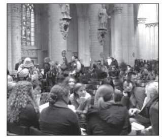
Csoportok megbeszélése a katedrálisban