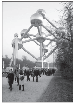
Brüsszel jelképe, az Atomium előtt