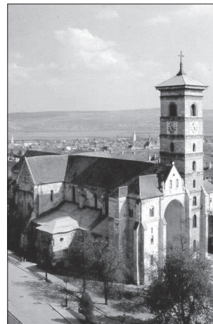
A gyulafehérvári Szent Mihály-székesegyház

A püspökség története – főleg a középkorban – elválaszthatatlan összefonódott Erdély történetével. Mindenkorai főpásztorai – egészen a legutóbbi időkig – a lelkipásztori feladatokon túl társadalmi, politikai és kulturális szerepet is