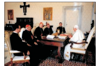
Az Európai Püspöki Konferenciák Tanácsának elnöksége a Szentatyánál

A CEE tevékenysége nagyon sokféle lelkipásztori munkaterületet ölel fel. Ezért sok szentségi hatóságnál járunk, ahol beszámoltunk az utóbbi másfél évben végzett munkánkról, másrészt pedig ötleteket, ösztönzéseket, útmutatásokat kaptunk a továbbiakra – mondta a bíboros a rádió munkatársának. Az Igazságosság és Béke Pápai Tanácsa azt várja tőlünk, hogy az európai szociális kérdésekről rendezzünk kontinentális méretű összejöveteleket, megbeszéléseket. A Vallások Közti Párbeszéd Pápai Tanácsánál, Tauran bíboros úrral beszélgettünk az iszlámmal folytatott pár-