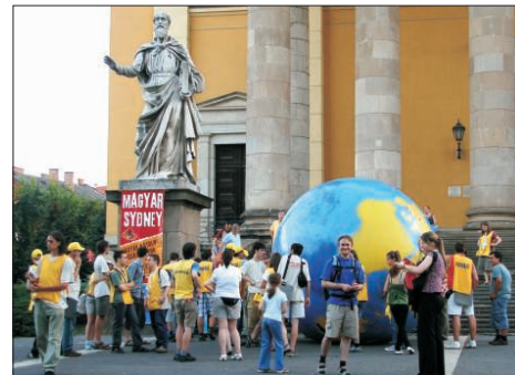
Az Ausztráliában zajló Ifjúsági Világtaglalkozóval egy időben „Magyar Sydney” elnevezéssel fiataljaink Egerben gyűltek össze, hogy lélekben bekapcsolódjanak a Föld túldoldalan zajló eseményekbe. Felvételünk a bazilika előtt készült

Mert kétségtelenül közös volt a nyelv a július 17–20-án megrendezett XXIII. Ifjúsági Világtaglalkozózn, lett legyen az a fő helyszínen, Sydneyben, vagy a nagy távolság, s az eljutás lehetőségének anyagi hiánya miatt több nemzet által is közelebbi helyszíneken létrehozott „kis Sydneyekben”. Hazánkban Eger vált a katolikus ifjúság „fővárosává” egy hétfővégére. S hogy ez igazi „társrendezvény” volt, azt Ternyák Csaba egri érsek köszöntőjében elhangzott szavaival megerősítette: az ad limina látogatáson szólt a Szentatyának a kezdeményezéséről, aki nagyszerű ötletnek vélte, s áldását is küldte az egri „ifjúsági világtalálkozóra”. Sőt, üzenet is érkezett tőle, felemlítve a központi gondolatot – „amikor a Szentlélek leszál rátok, erőben részesültök, úgyhogy tanúságot tesztek majd rólam” – s kérve: „Hívjuk tehát a Szentlelket, akit nem határolnak be a földrajzi fekvés koordinátái, és egyesít bennünket imádságban és tanúságtételben.” Ternyák Csaba érsek jó házigazdaként szinte végig jelen volt a rendezvényeken, szeretetteljes gondoskodással vette körül a résztvevő fiatalokat, a páspágot, s püspökjelöltjeit – akik közül sokan eljöttek, érzékeltetve, hogy kiemelt jelentőségűnek tartják e programot. Szentmisét, vagy katekézist vezetett