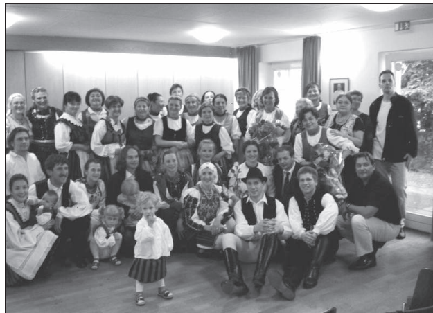
A jubiláló néptáncsoport fotója a misszió honlapjáról

Taposalmukból kilépvé, Járják a táncot hétről hétre. Aki őket csak egyszer látta, Velük perdül életre-halálra. Hétfők, heteink vasárnapja, Tartsatok örök varázslatba.