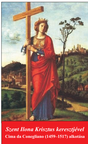
Szent Ilona Krisztus keresztféjével Cima da Conegliano (1459–1517) alkotása

A Szentlélek erejével eltelve és a hit gazdag látomásától vezette egy új nemzedék kap meghívást arra, hogy segítsen építeni egy olyan világot, amely örömmel fogadja, tiszteli és szereti Isten ajándékát, az életet, nem pedig elveti, nem tartja fenyegetésnek és rombolja le. (...)