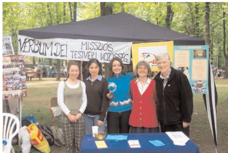
A Verbum Dei közösség bemutatóján a budapesti Karizmusok napján, 2005. június 26-án, a máriaremetei templomkertben.

Isten bensőséges párbeszédbe von minket Krisztusban. Ebben a személyes találkozásban Isten szeretete lépésről-lépésre átalakítja szívünket és egész életünket. Ez a krisztusi tapasztalat Istennek szentelt életünk boldogságának forrása, és arra sürget minket, hogy igéje elérhessen minden emberhez. Sajátos küldetésünket Pál