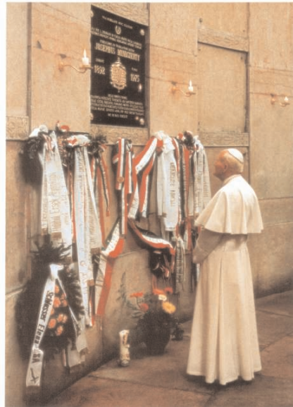
II. János Pál pápa magyarországi látogatása Mindszenty József hercegprímás sírhelyénél, az esztergomi bazilika altemplomában, 1991. augusztus 16-án.

illették, és attól sem riadtak vissza, hogy az általa vezetett liturgiát megzavarják. 1948. december 26-án letartóztatták, börtönbe vetették és kegyetlen vallatási módszerrel kínozták. Durván, még gumi-