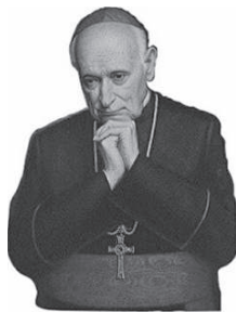
Mindszenty bíboros egész papi élete áldozat volt, Isten dicsőségére és népe üdvösségére.

évvel ezelőtt a szombathelyi székesegyházban szentelte pappá gróf Mikes János megyéspüspök. Szentelő püspöke a zabolai Mikes grófok székely fia. Így már szentelő püspökével is kapcsolatba lép lélekben Székelyfölddel. A papi hivatást a jó Isten adja, de földi eszményképeket szemlélve testesül meg. A pap nem hősködik, de Krisztusban bízva, hittel a kegyelem erejében meri vállalni a papi hivatást, mint Szent Péter. Mindszenty bíboros is sok szentéletű pap között élt ifjú korában, akiknek életvitelén megláthatja, milyen a papi élet, amelyre hivatást kapott. X. Szent Piusz tanítása szerint a papi hivatáshoz három feltétel kell: legyen meg a testi-lelki egészsége és ereje a papi hivatás teljesítéséhez, hívja Krisztus, vagyis vegye föl egy egyházmegye püspöke vagy egy szerzetesrend előjárója, azért akarja a papságot, amiért Krisztus alapította: Isten dicsőségére és a lel-