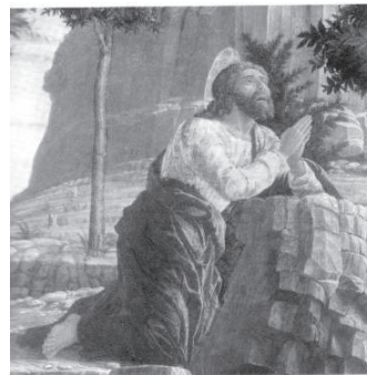
Andrea Mantegna, Imádság a Getszemáni kertben, 1455.